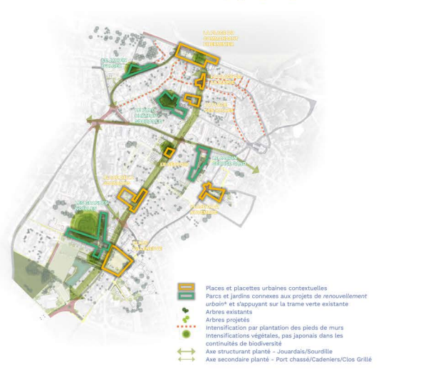
Les espaces publics et la diffusion du paysage ligérien