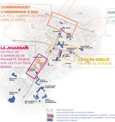
La stratégie commerces et services