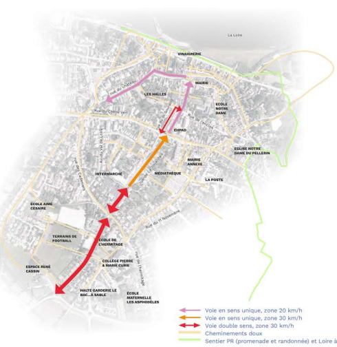
Schéma de circulation projeté