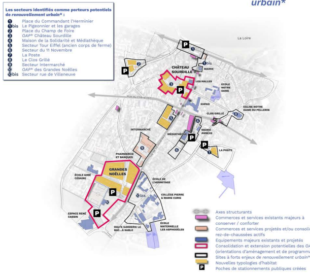
Les secteurs de renouvellement urbain*