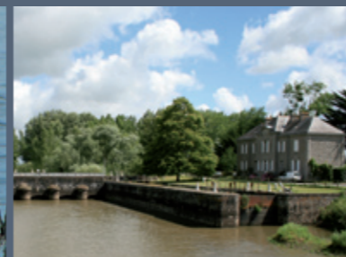
Écluse des Champs Neufs et bureau de l'ONCFS