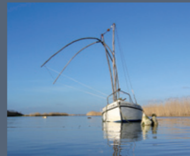
Pêche au carrelet sur la Loire