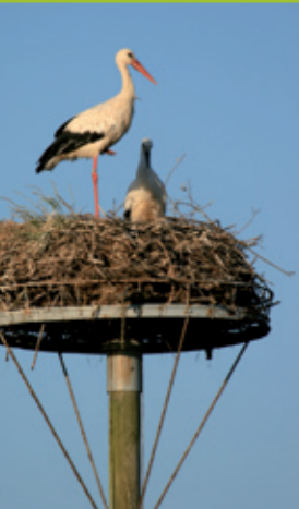
Chemin des Carris - Cigogne blanche